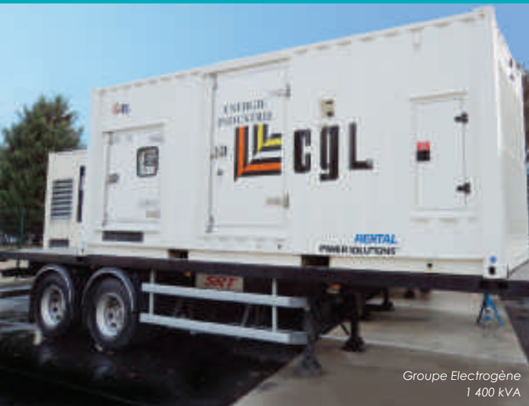
Groupe Electrogène 1 400 kVA