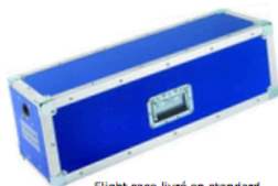
Flight case livré en standard